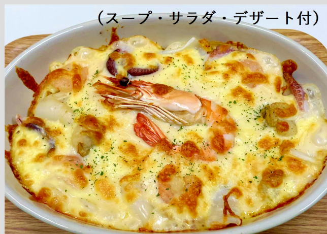
シーフードドリア ¥1,100